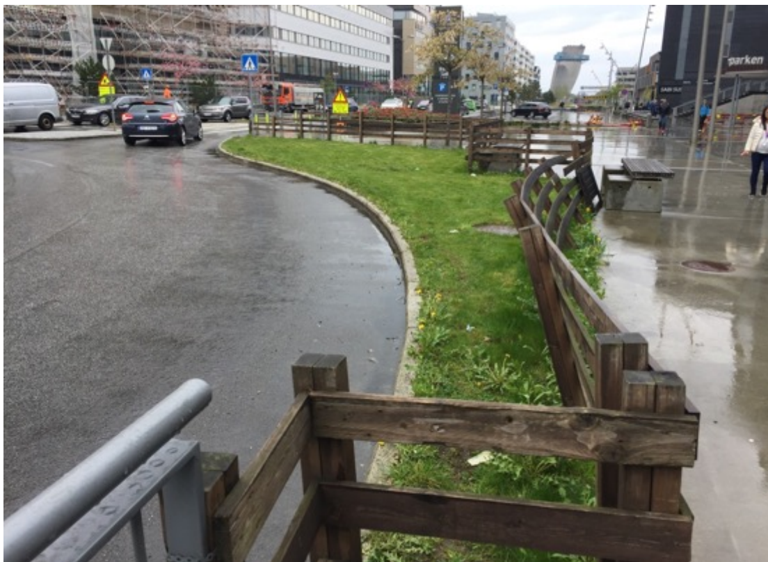
Hinna august 2019