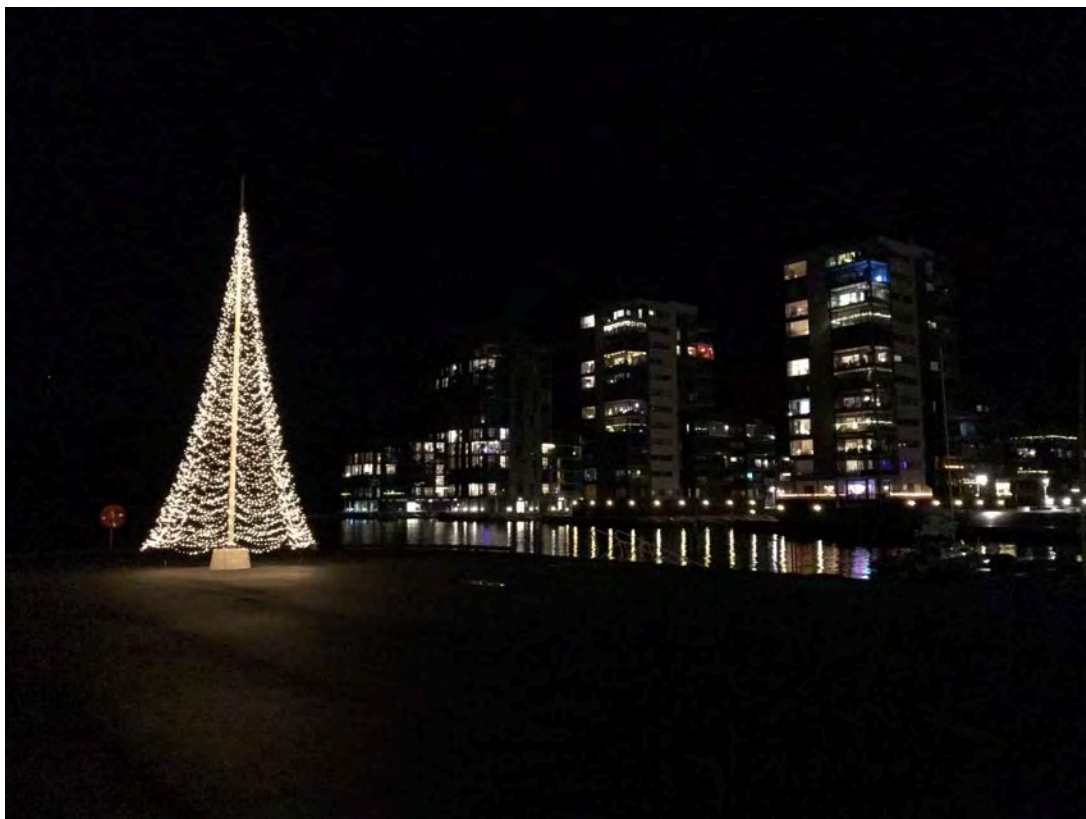
Hinna august 2019