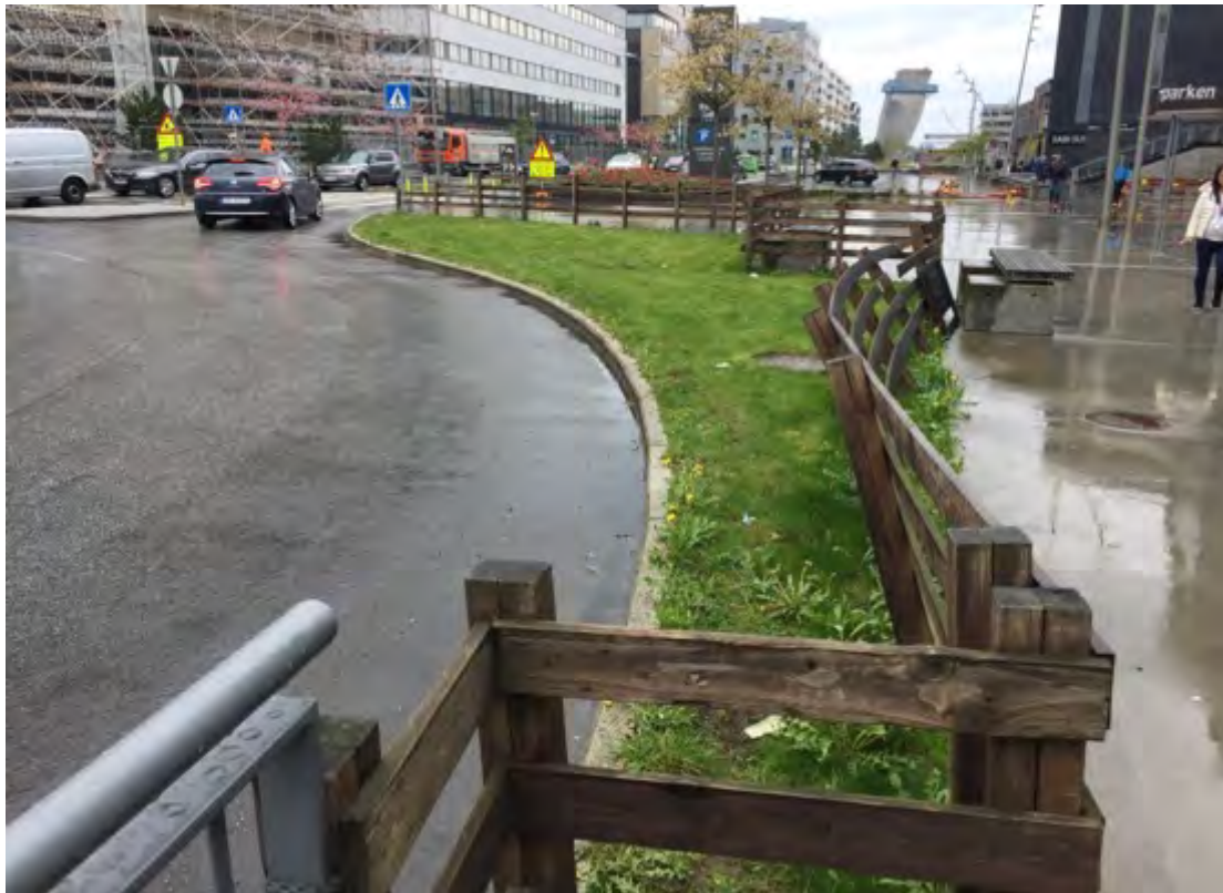
Hinna august 2019